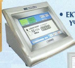
• ΕΚΤΥΠΩΤΕΣ ΚΙΒΩΤΙΩΝ ΥΨΗΛΗΣ ΕΥΚΡΙΝΕΙΑΣ - BARCODE