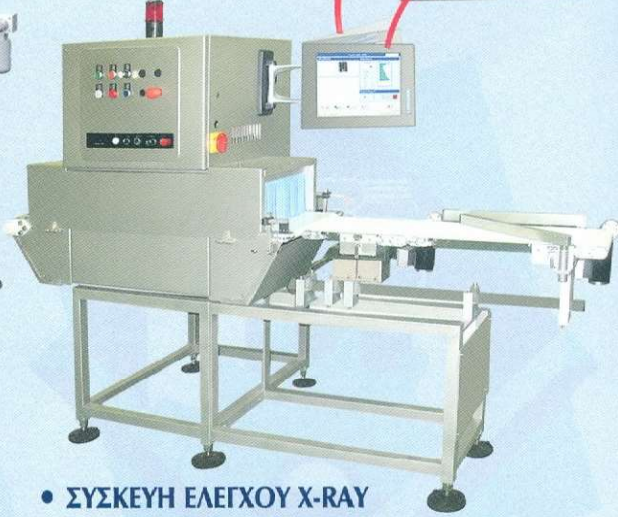
• ΣΥΣΚΕΥΗ ΕΛΕΓΧΟΥ X-RAY - ΣΥΣΚΕΥΗ ΕΛΕΓΧΟΥ ΒΑΡΟΥΣ (COMBI)