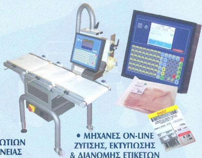
• ΜΗΧΑΝΕΣ ON-LINE ΖΥΓΙΣΗΣ, ΕΚΤΥΠΩΣΗΣ & ΔΙΑΝΟΜΗΣ ΕΤΙΚΕΤΩΝ