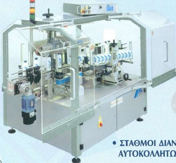
• ΣΤΑΘΜΟΙ ΔΙΑΝΟΜΗΣ ΑΥΤΟΚΟΛΛΗΤΩΝ ΕΤΙΚΕΤΩΝ