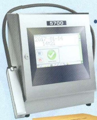
• ΕΚΤΥΠΩΤΕΣ INKJET