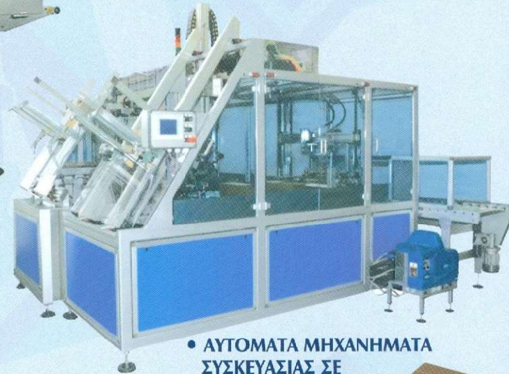
• ΑΥΤΟΜΑΤΑ ΜΗΧΑΝΗΜΑΤΑ ΣΥΣΚΕΥΑΣΙΑΣ ΣΕ ΧΑΡΤΟΚΙΒΩΤΙΑ