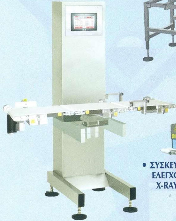
• ΣΥΣΚΕΥΕΣ ΕΛΕΓΧΟΥ X-RAY